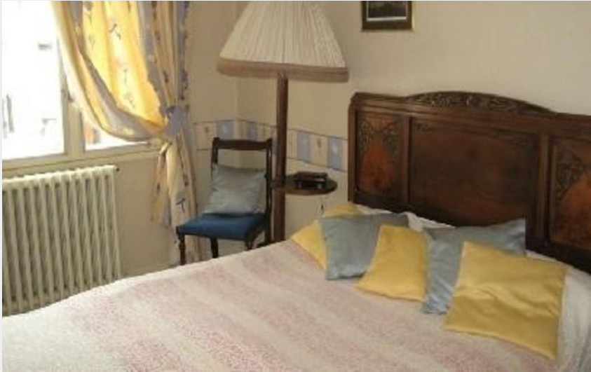
Crédit : Maison dans le village Villefort - Deux chambres à l'étage (Embriaco)