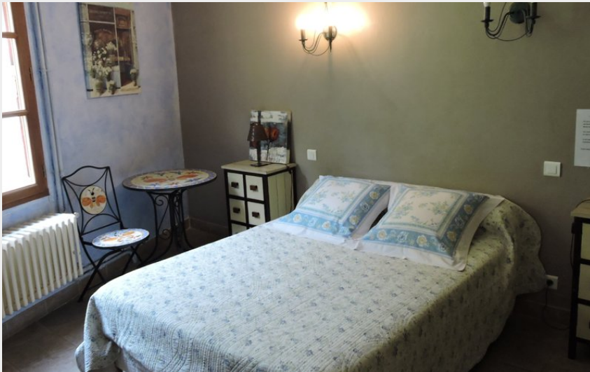
Crédit : HOTLAR0480000040_01 (Bleu Nuit)