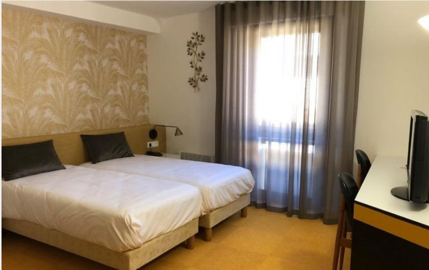
Crédit : chambre au style moderne grand hotel du parc Florac (Office du tourisme)