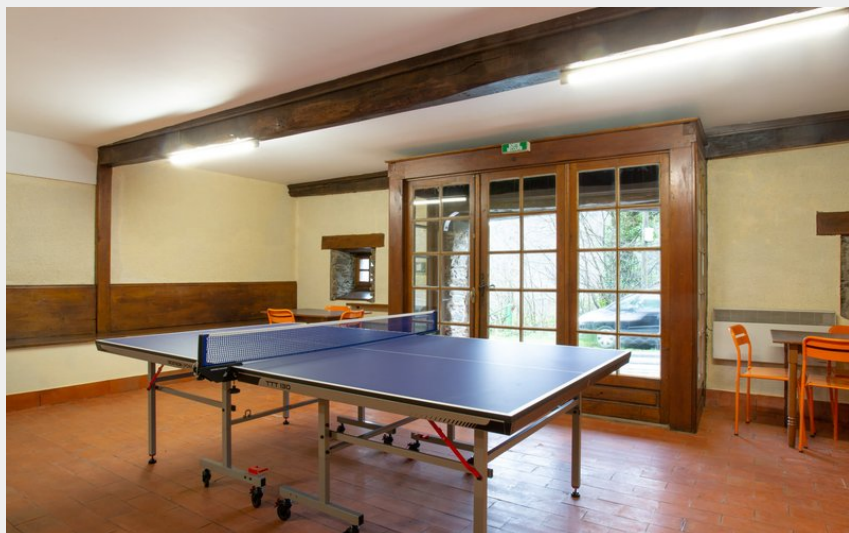
Crédit : G1765 - La Moulinquié - Saint-Cirgue (ATTER Gîtes de France Tarn)