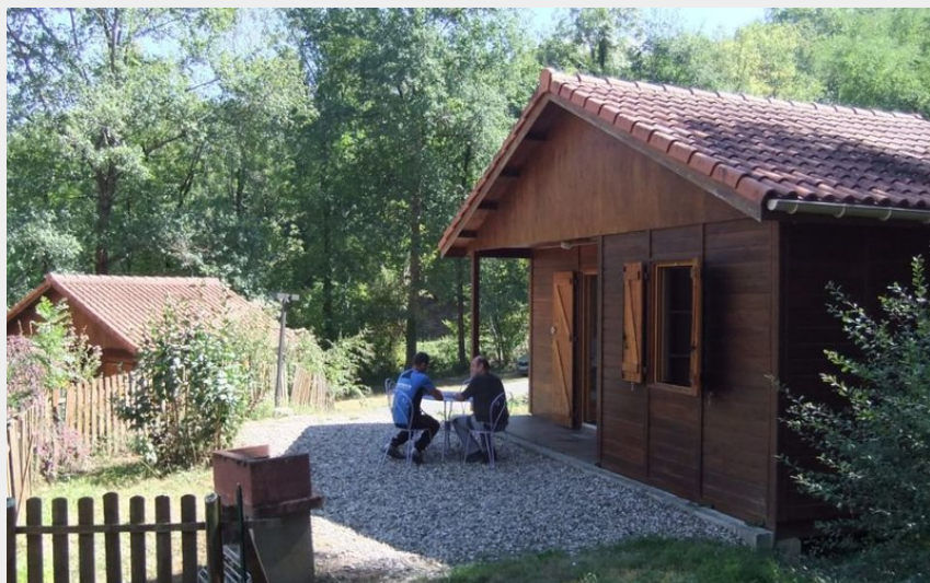
Crédit : Chalet - Vallée du Tarn - Albi - Tarn - Région occitanie méditerranée - Sud Ouest (Clévacances)