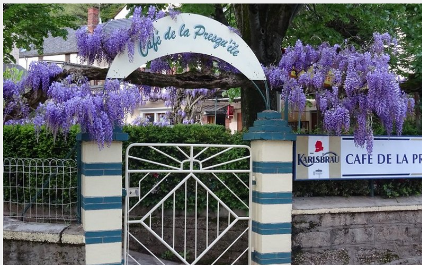
Façade Café de la Presqu'île Ambialet