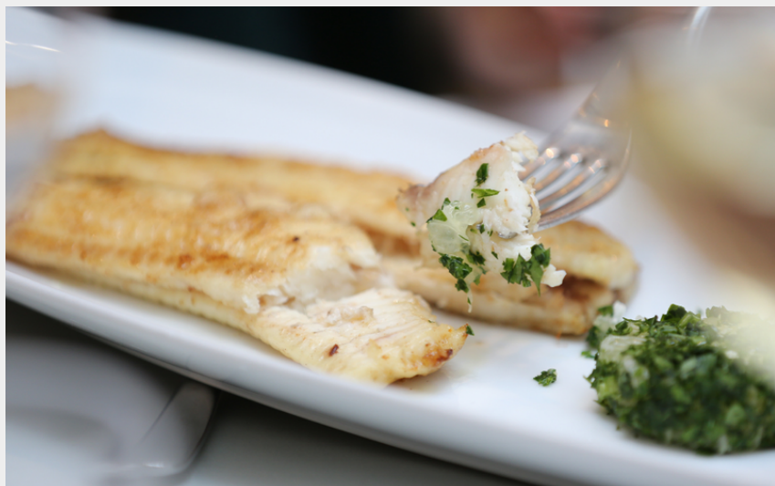
Albi plat