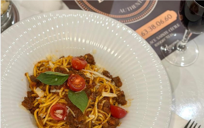
Crédit : Del Duomo: restaurant et pizzeria_Albi (Del Duomo: restaurant et pizzeria_Albi)