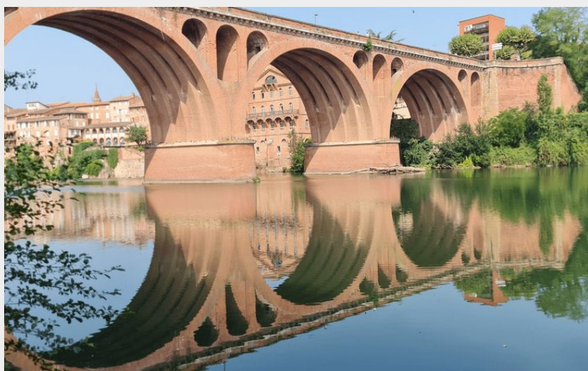
Crédit : Balade dans le centre historique d'Albi_Albi (Albi Tourisme)