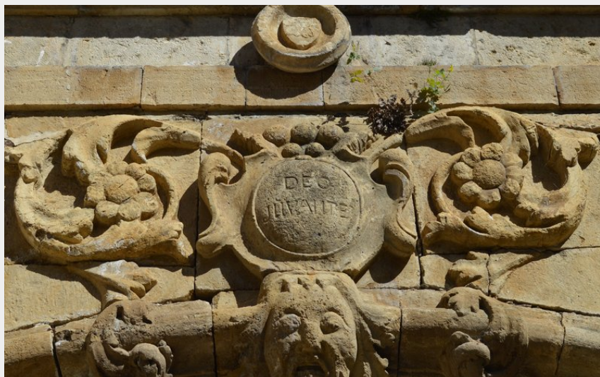
Portail du couvent des Ursulines - Ispagnac