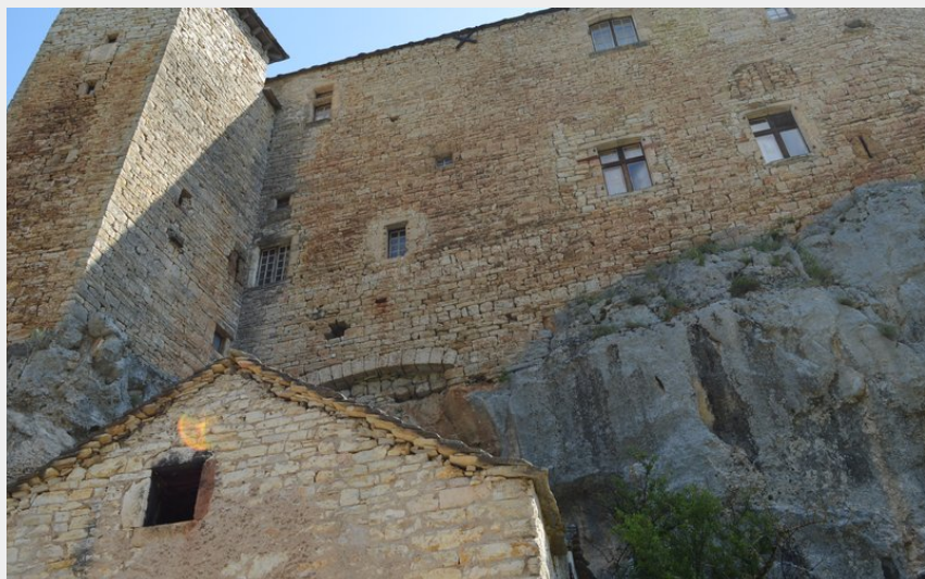
Crédit : Château de Prades (Roxane Carrat - Conseil départemental Lozère)