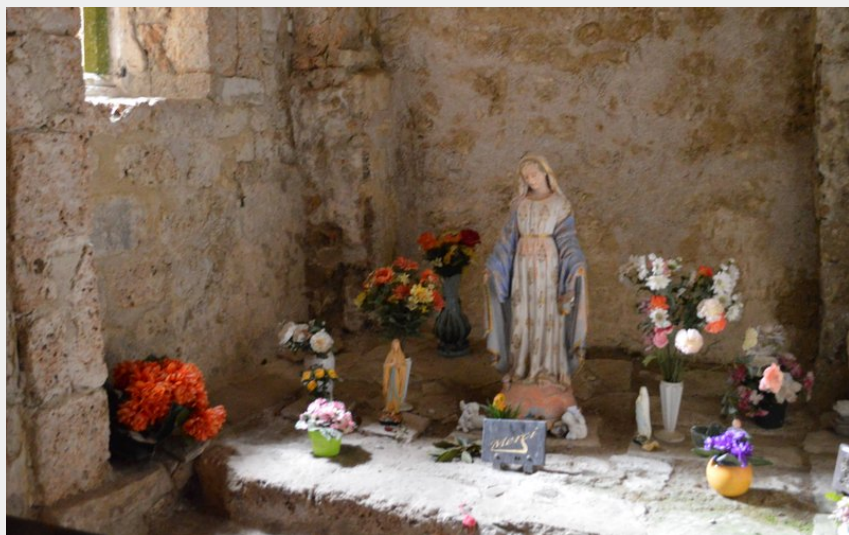
Chapelle Notre-Dame de Cénaret