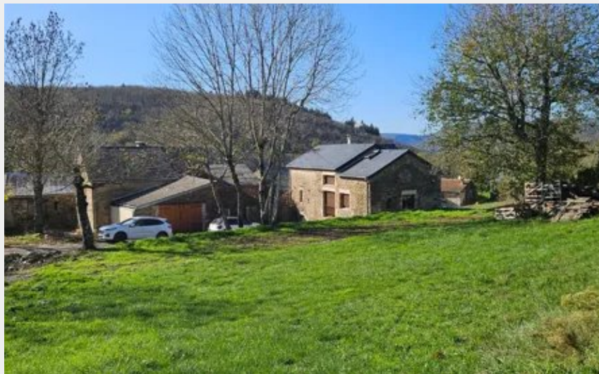
Crédit : Façade de la maison