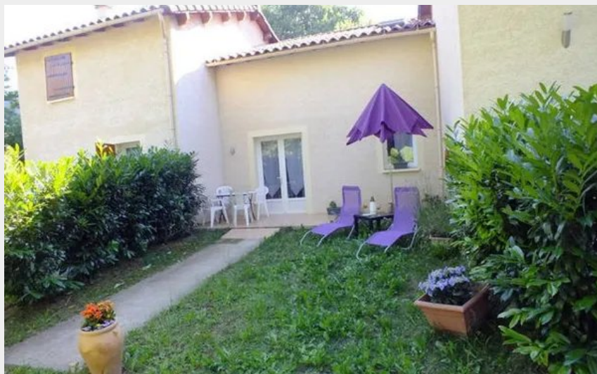
Crédit : Gîte des deux rivières (OFFICE DE TOURISME LARZAC VALLEES)