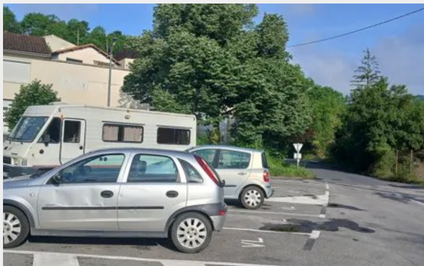
Aire de stationnement de Saint-Affrique