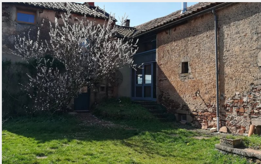
Crédit : Gîtes de Faragous - Moyen Gîte (Gîte de Faragous (groupes))