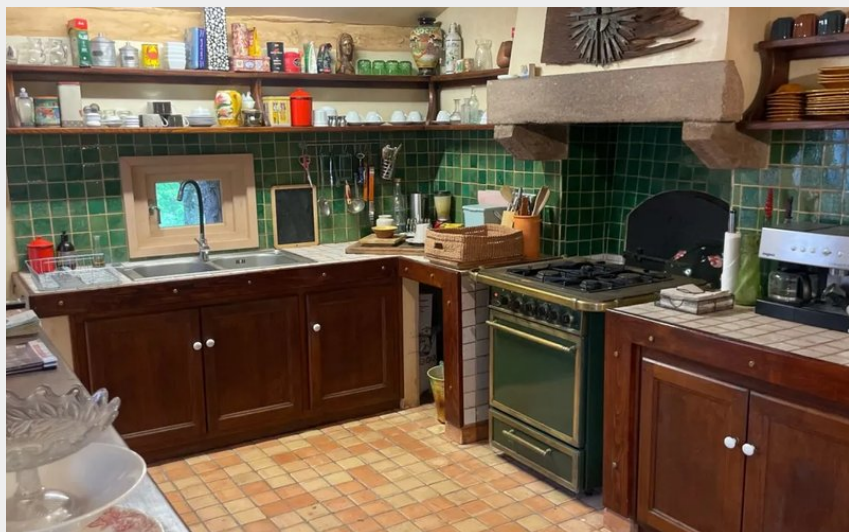
Crédit : Cuisine d'été mise à disposition des hôtes