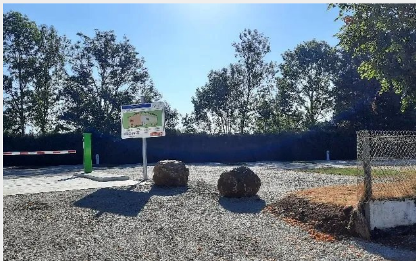
Crédit : Aire de camping-car de Cantoin (Office de Tourisme en Aubrac)