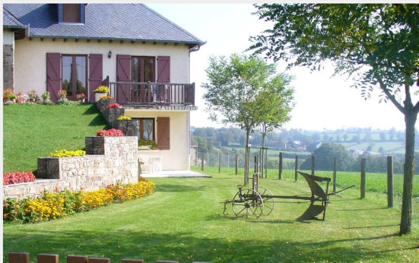
Crédit : Location Mme Guitard à Comps - jardin clos (Mme Guitard à Comps)