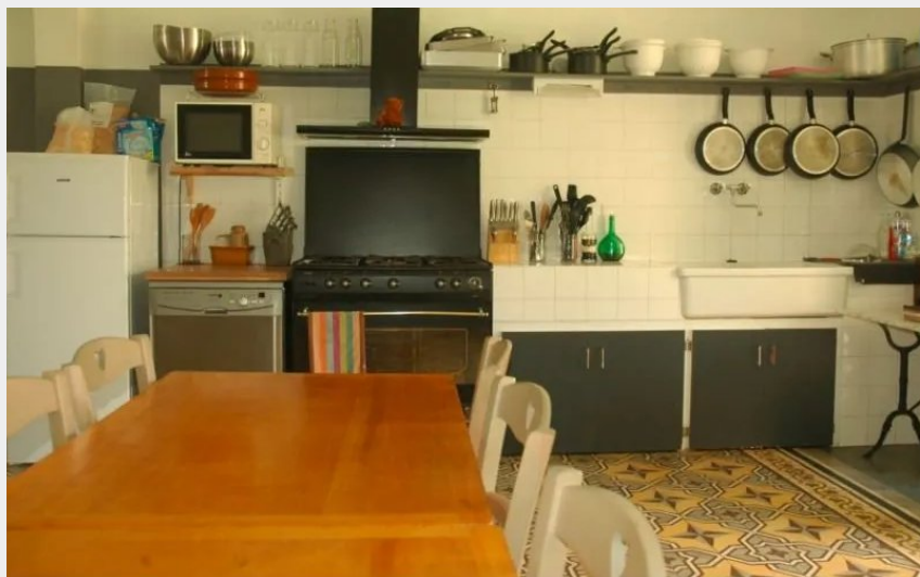
Crédit : Grand gîte du Larzac - Petit gîte 1 (OFFICE DE TOURISME LARZAC VALLEES)