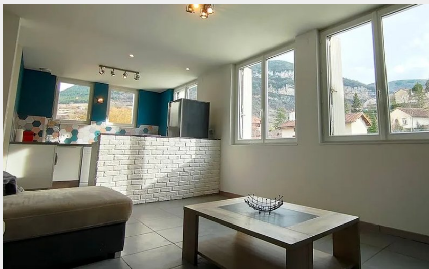
Salon - Salle à manger