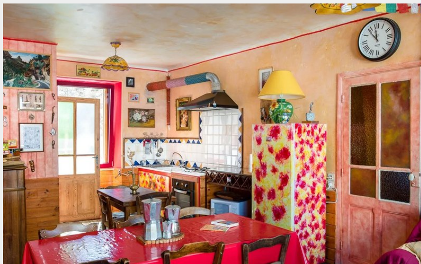
Crédit : Niveau 2 : la salle commune colorée et animée (Gîte La Jeanne)