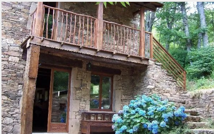
Crédit : vue entrée