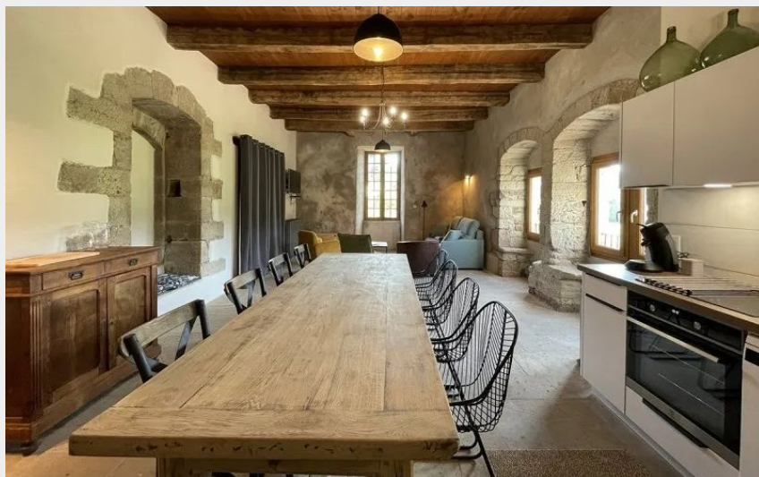
Crédit : Château de Latour - Meublé Rivière (Château de Latour-sur-Sorgues)