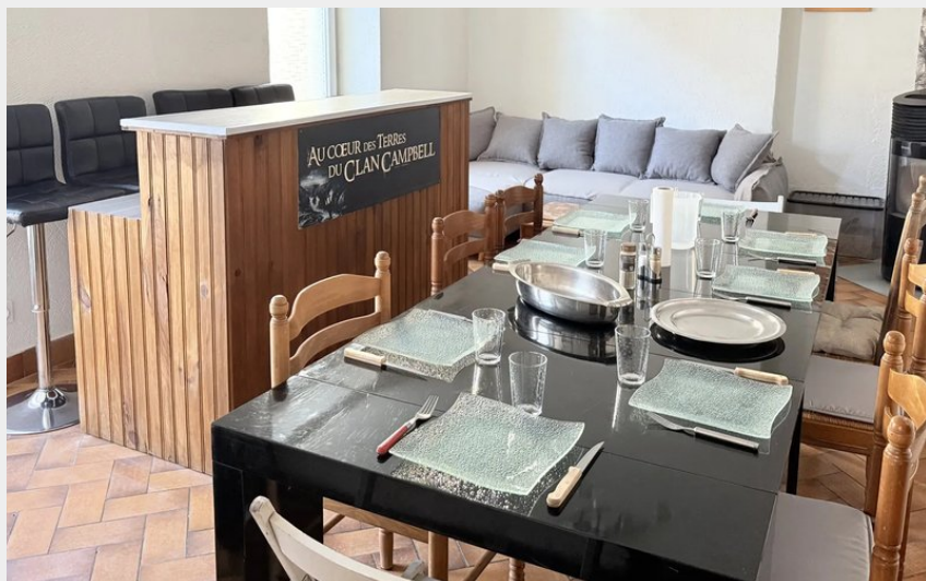
Crédit : salon coin bar avec table