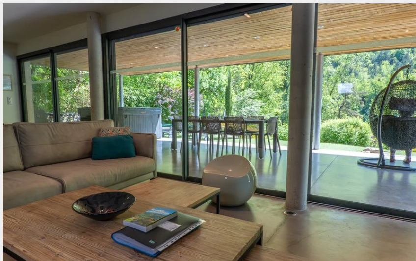
Crédit : Vue extérieur du salon (Gite Emeraude © Stephanie Cailbeaux, 2025)