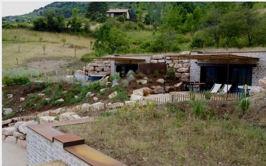
Crédit : Vue de l'ensemble