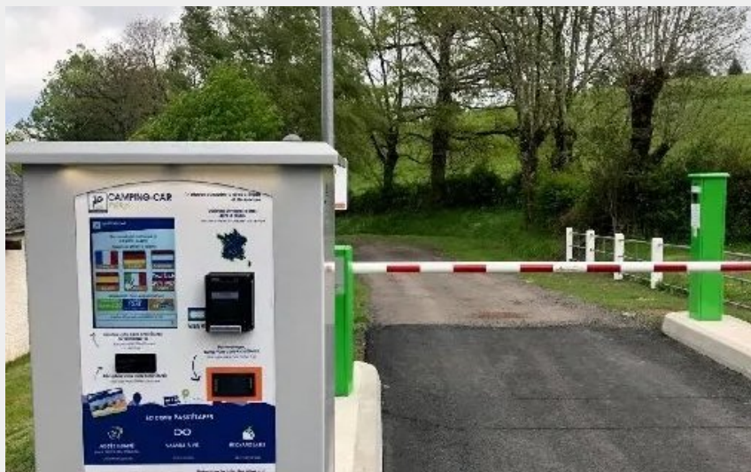
Crédit : Aire de camping-car de Mur-de-Barrez (Office de Tourisme en Aubrac)