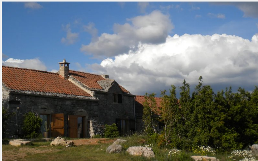
Crédit : Vue extérieure gîte de Loulette