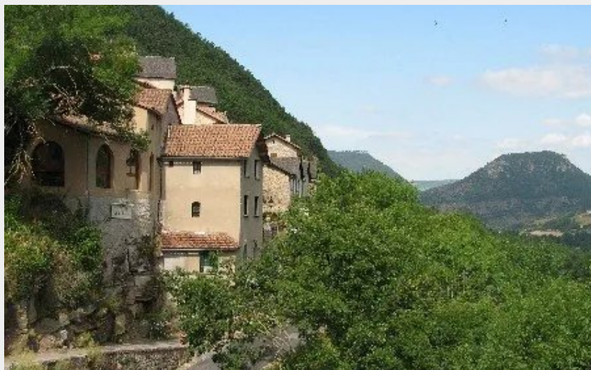
Crédit : le gîte, vue sur la vallée du Tarn (Gîte et Rando Evolutions - Les Corniches de la Jonte)