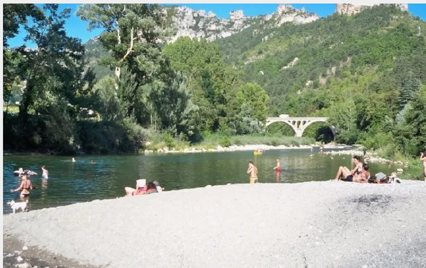
Crédit : Plage confluent Jonte/Tarn Camping Brudy-Brudy Plage** (CAMPING BRUDY - BRUDY PLAGE)