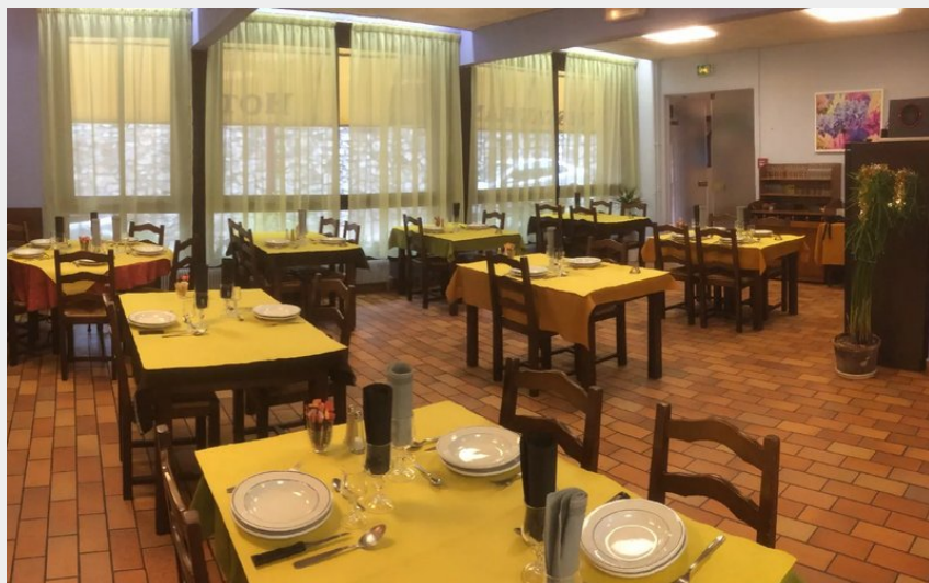
Crédit : salle de restaurant - Hôtel l'Agapanthe (Hôtel l'Agapanthe)