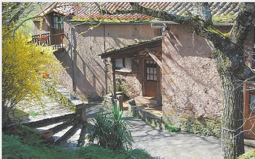
Crédit : La maison au potager (Office de Tourisme Rougier d'Aveyron Sud)