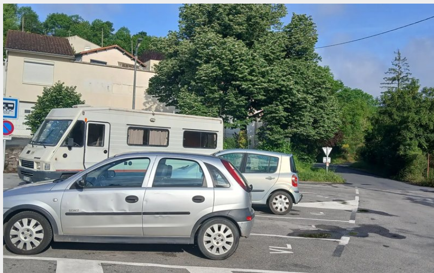
Aire de stationnement de Saint-Affrique