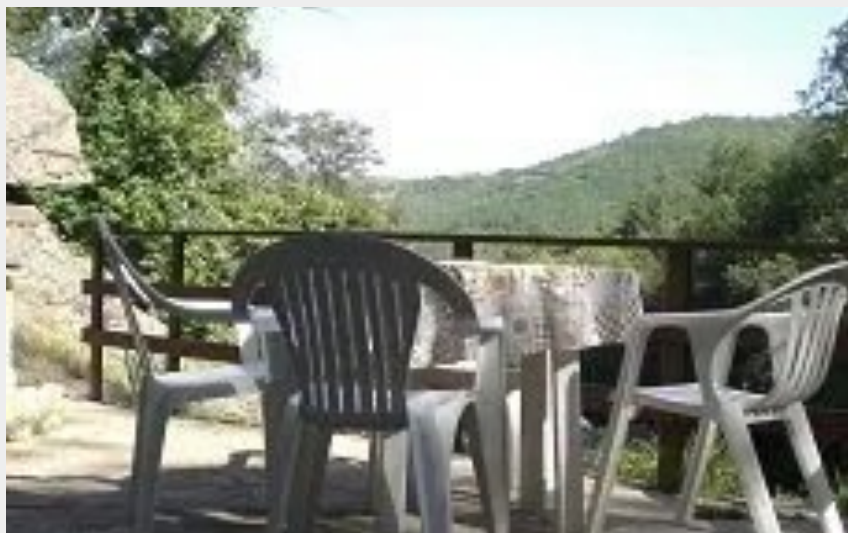
Crédit : Domaine la Clairière - gîte 2 à 4 personnes avec véranda