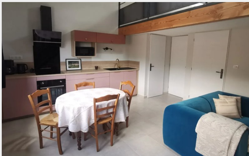
Crédit : Cuisine ouverte sur salon