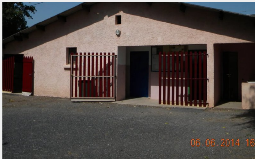
Crédit : Aire de camping-cars municipale (Salle du Pressoir au Château de Saint-Izaire)