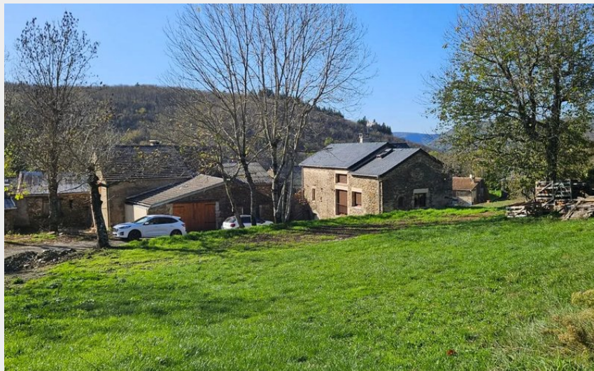
Crédit : Façade de la maison