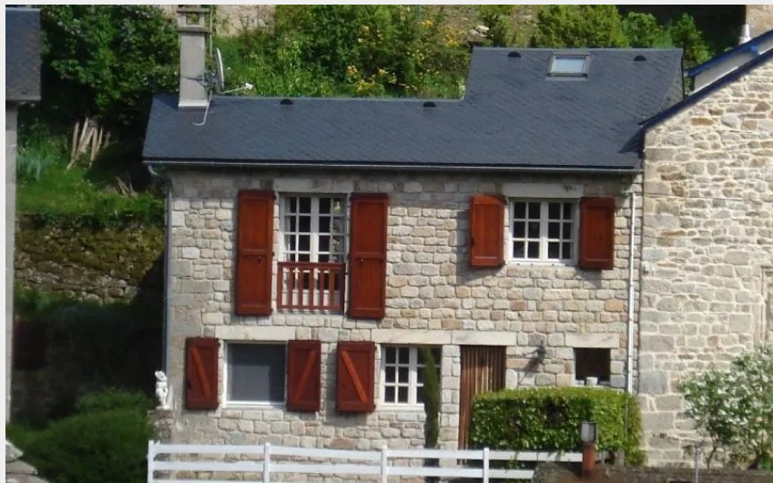
Crédit : Mme Véronique Lafon location Saint Léons (Mme Véronique Lafon)