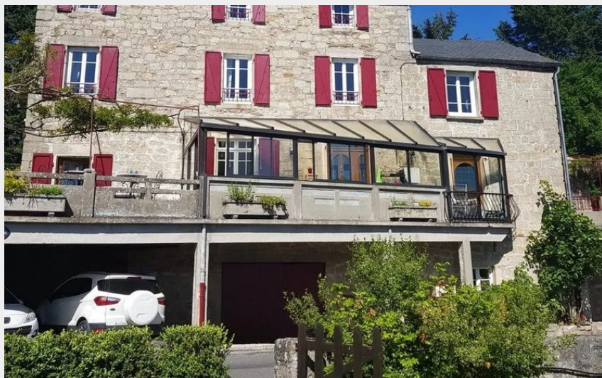
Crédit : La pierre pointue (OFFICE DE TOURISME DE PARELOUP LEVEZOU)