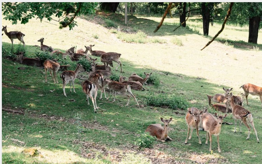
la colline Saint Martin, avec des daims en semi-liberté