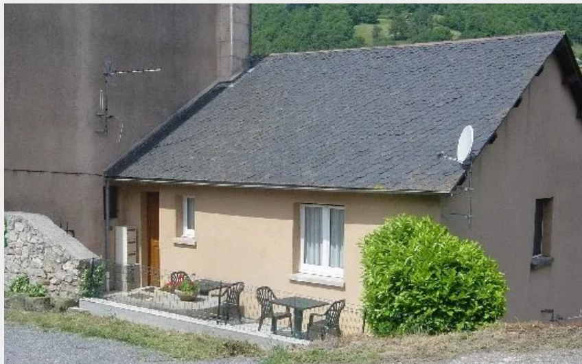
Crédit : Andrée VILLENEUVE - GITE 1 (OFFICE DE TOURISME DU PAYS SAINT-SERNINOIS)