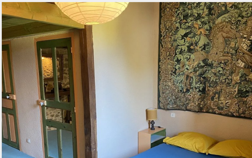
Crédit : Domaine de Linars - La Forge (Château de Linars - L'aile du château)