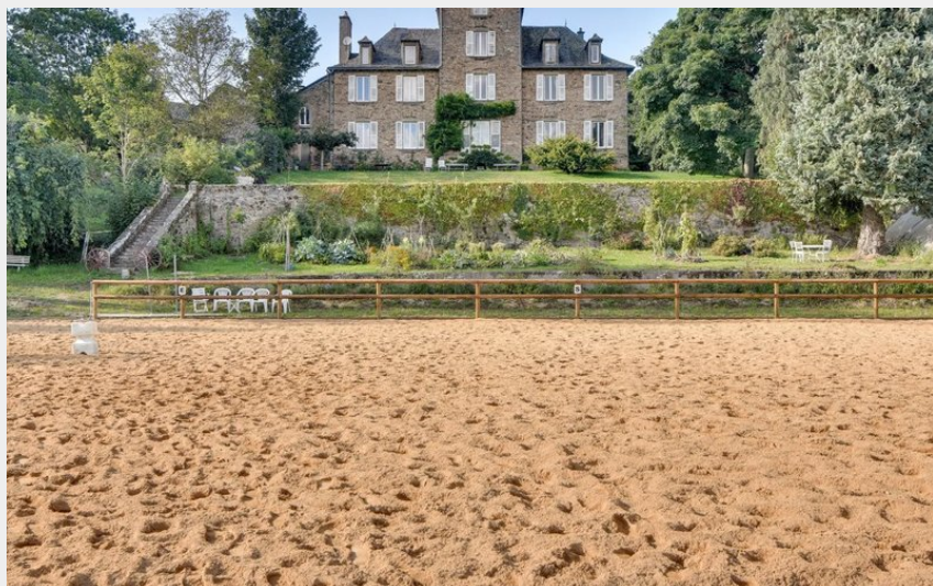
Crédit : Château de Linars - L'aile du château (Château de Linars - L'aile du château)