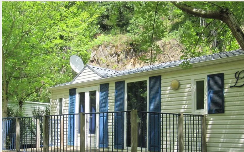
Crédit : Mobile-home 2 chambres Camping de la Prade (Camping Municipal La Prade)