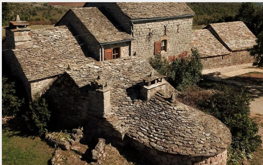
Crédit : vue d'ensemble