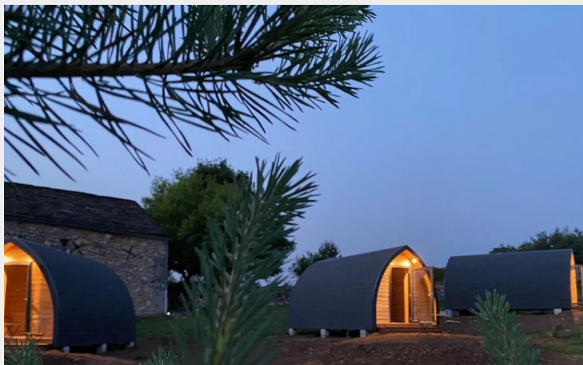
Crédit : Pigne vu extérieur