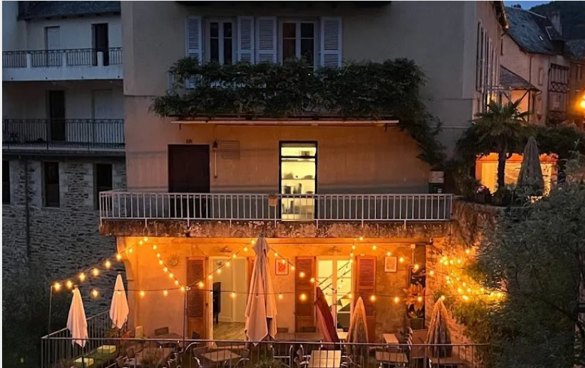
Crédit : Brasserie du Château - Terrasse (Restaurant - Brasserie du Château)