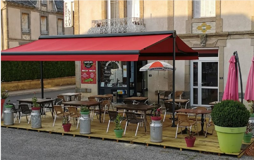
Crédit : La Coulée des Saveurs (OFFICE DE TOURISME DU CANTON DE MUR DE BARREZ)