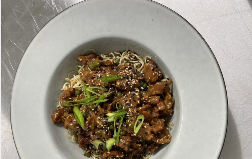
Crédit : Les Terrasses du Durzon (OFFICE DE TOURISME LARZAC VALLEES)